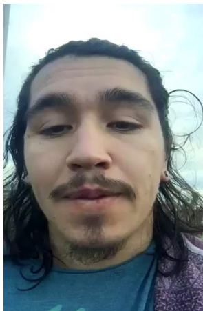
Ignacio Urrea Producción Leche Nueva Zelanda